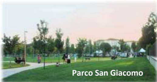
Parco San Giacomo