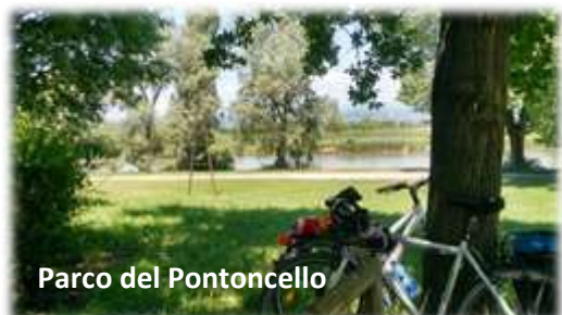
Parco del Pontoncello

(verrà in parte riproposto il percorso del 18 marzo su richiesta di chi non ha partecipato per il maltempo)