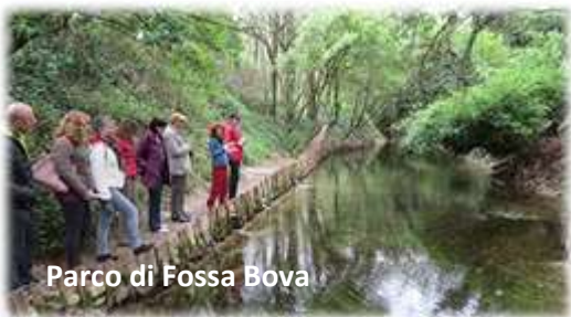
Parco di Fossa Bova