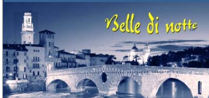
Il fascino delle città nell’atmosfera serale