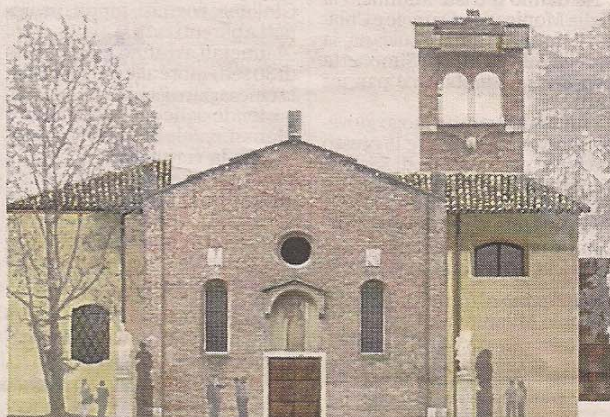
La chiesa dell'antico ospedale S. Giacomo e Lazzaro